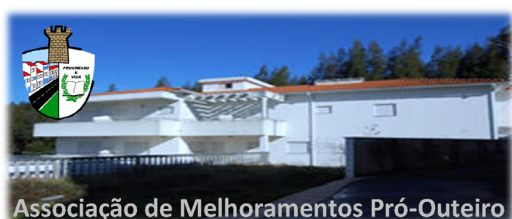
Associação de Melhoramentos Pró-Outeiro

Fique a saber como é que pode ficar a beneficiar com o preenchimento da sua declaração de IRS e como deverá proceder para que a AMPO possa beneficiar, sem que isso represente qualquer esforço da sua parte.